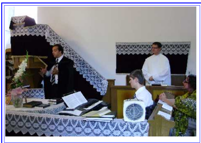
Ökumenikus istentisztelet Tiszaugon augusztus 20.