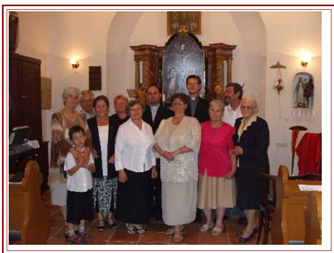
Búcsúünnep a tiszaugi hívekkel.....