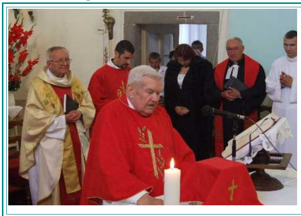
Cséparóól elszármazott papok találkozója Szt. Jakab napi búcsúban