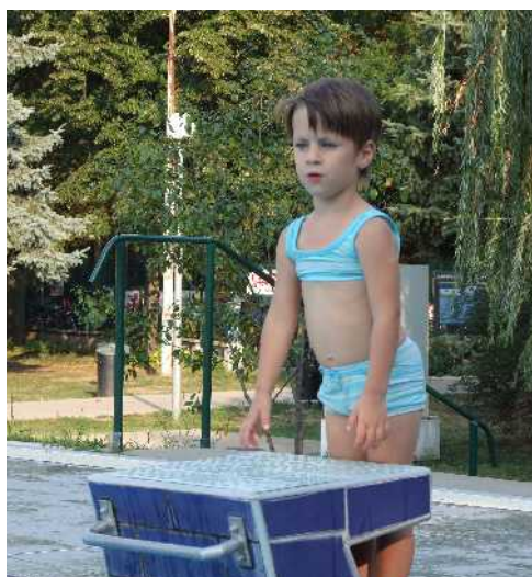
...be is menjek, ne is menjek?..