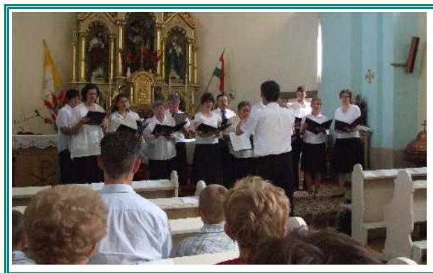
Tiszaalpári templomi kórus koncertje