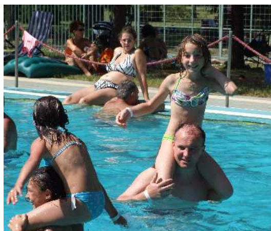
„kakas viadal” a vízben