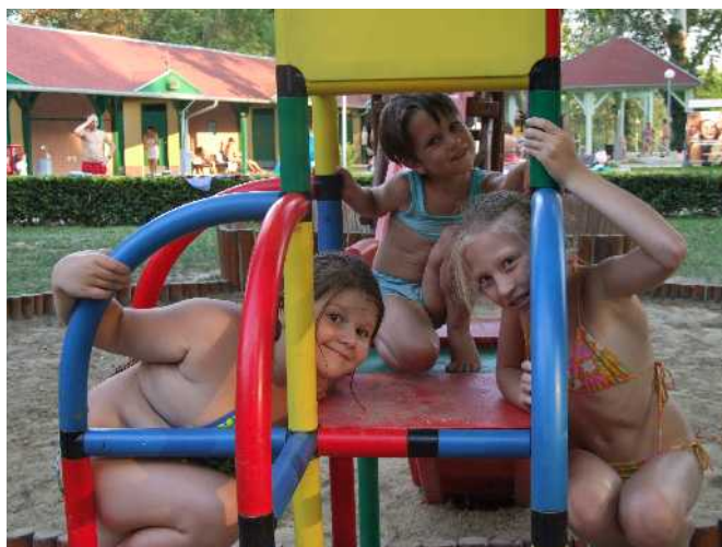
Kíváncsiak vagytok hol voltunk strandon?