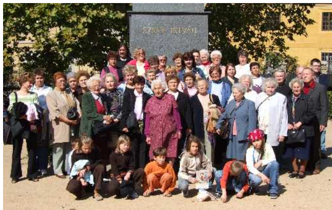
Csoportkép Szent István szobra előtt