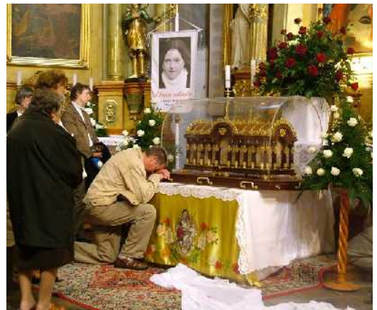
Kis Szent Teréz ereklyéi az egyik mellékoltárnál

Dénes atya szíves közreműködésével kis csoport indult Cséparól és Haleszból is, hogy mi is részesülhessünk a Kis Szent Teréz által árasztott kegyelemből. Az ereklye délután két órakor érkezett a Szentháromság térre. Az ünnepélyes fogadás után elhelyezték az ereklyét a templomban. Öröm volt látni a megtelt templomot, ahol mindenki személyesen megérintette az ereklyetartót. Később képes bemutató következett, mely életútját mutatta be gyermekkorától korai haláláig. Ezután a Dicsőséges Rózsafüzért imádkoztuk Szent Teréz gondolataival kiegészítve. Ezt követte az esti dicséret, majd az ünnepi szentmise, ahol hálát adhattunk a Kis Szent Terézzel való találkozásunkért. A helyi hívek tanúságtétele után indultunk haza, de a program folytatódott egészen másnap délig, amikor az ereklyét továbbszállították Budapestre.