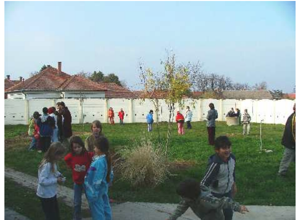
Két évvel ezelőtt is jól éreztük magunkat