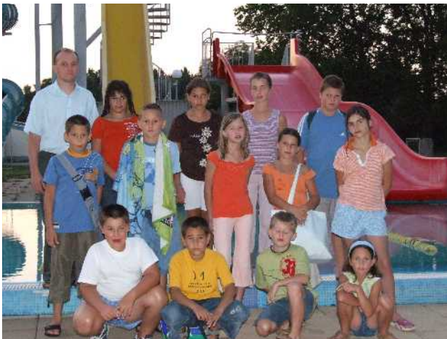
Nyári játékos napok egyike a szentesi strandon a gyerekekkel