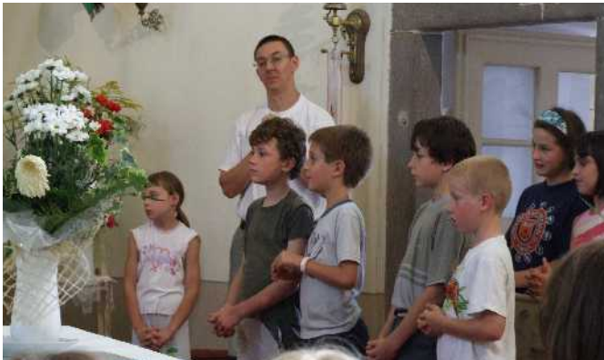
„Missziós Ház” benépesült a nyáron a veresegyházi fiatalokkal