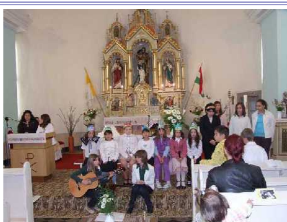
Anyák napja a csépai gyerekekkel