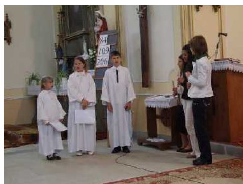
Anyák napja a szelevényi gyerekekkel