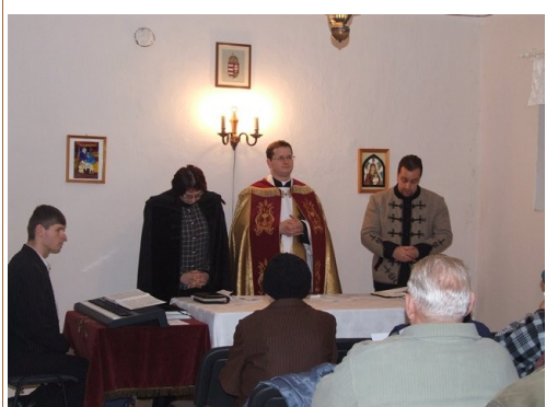
Ökumenikus imahét Tizsakúrtön