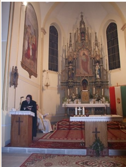
Ökumenikus imahét Szelevényen