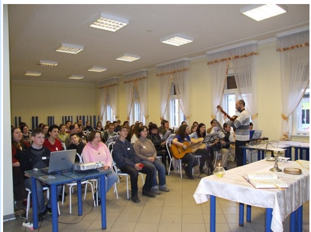
Ifjúsági találkozó Cegléden