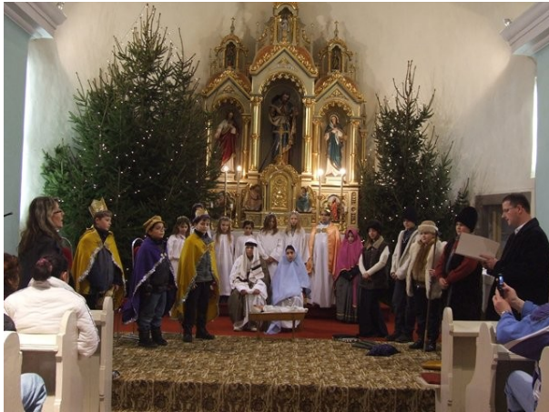
Pásztorjáték a csépai gyerekekkel...