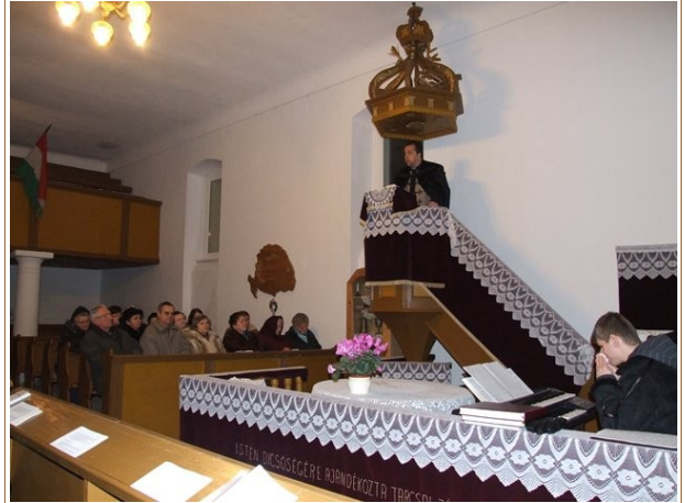
Ökumenikus imahét Tiszaugon