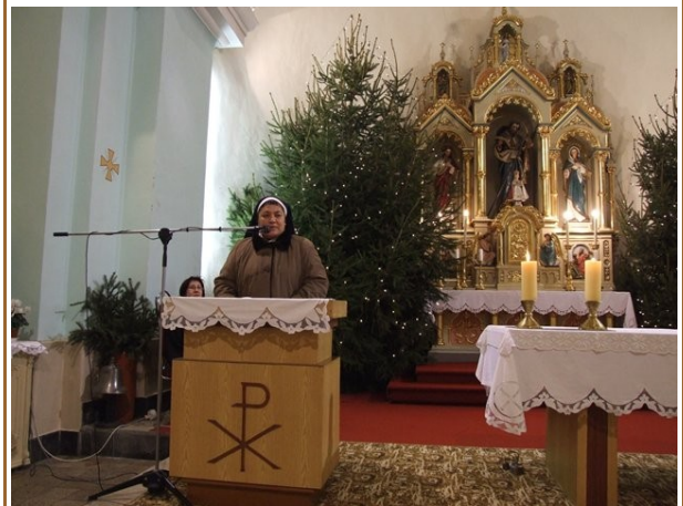
Ökumenikus imahét Csépan